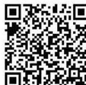
▲レシ活 チャレンジ